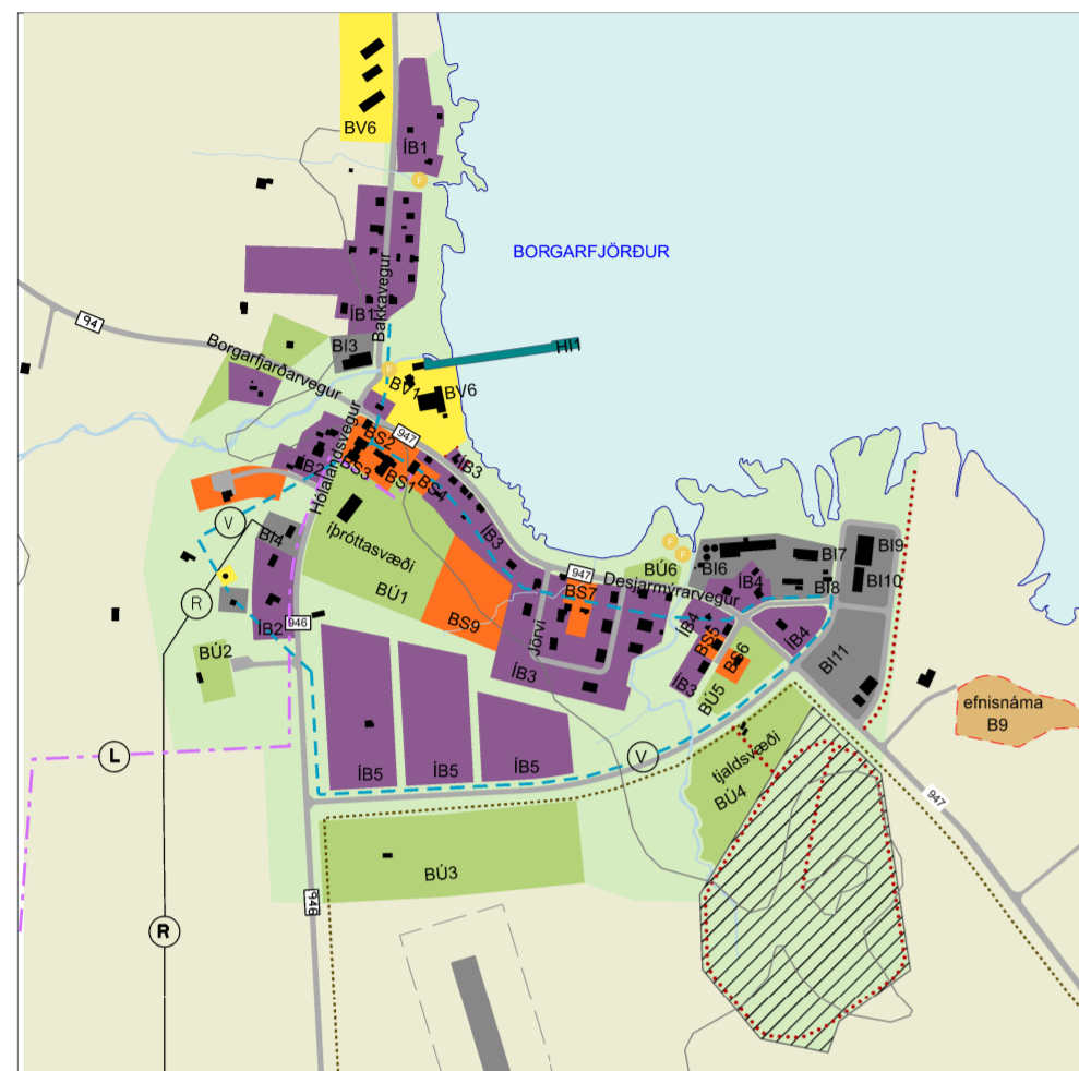
Gildandi Aðalskipulag, þéttbýlisuppdráttur staðfestur 13.05.2008 og 21.01.2021. Mkv. 1:10.000.