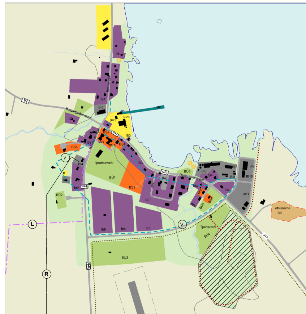
Breyting á aðalskipulagi, þéttbýlisuppdráttur. Mkv. 1:10.000.