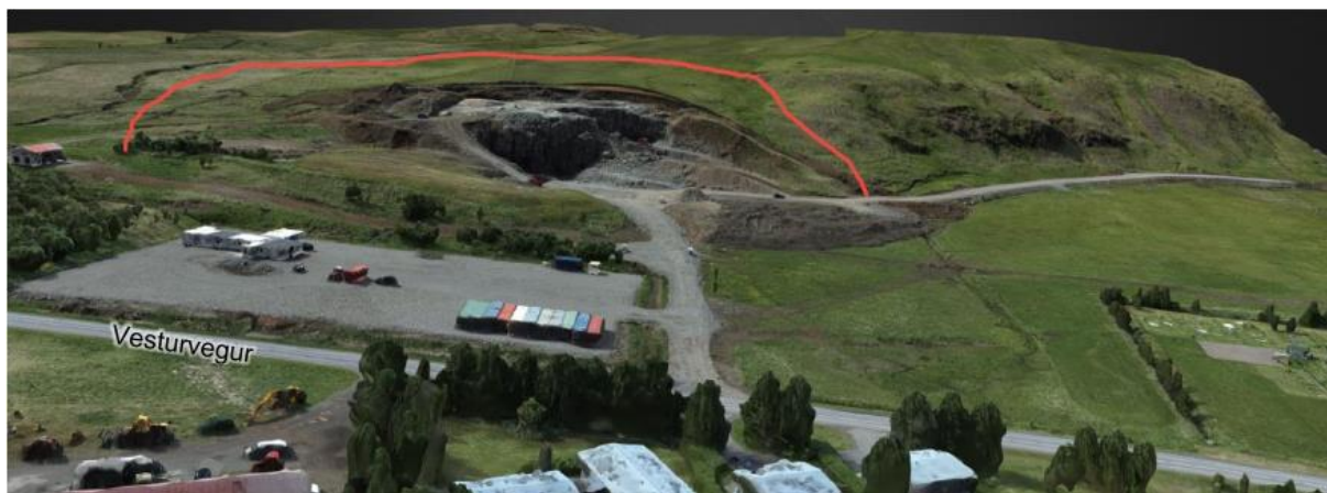
Mynd 2. Mynd sem sýnir Skaganámu frá Vesturvegi. Rauðlína sýnir umfang fyrirhugaðrar stækkunar.