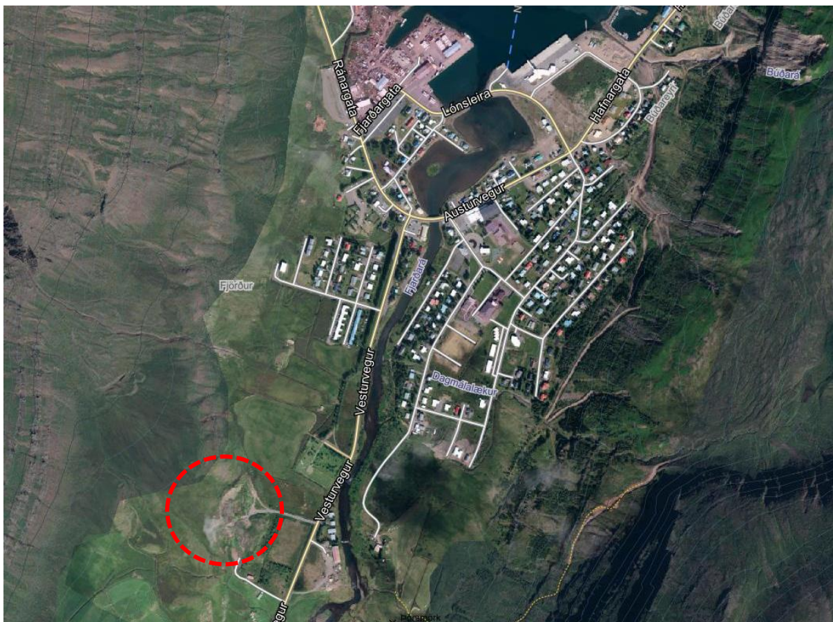
Mynd 1. Yfirlitsmynd sem sýnir staðsetningu Skaganámu.