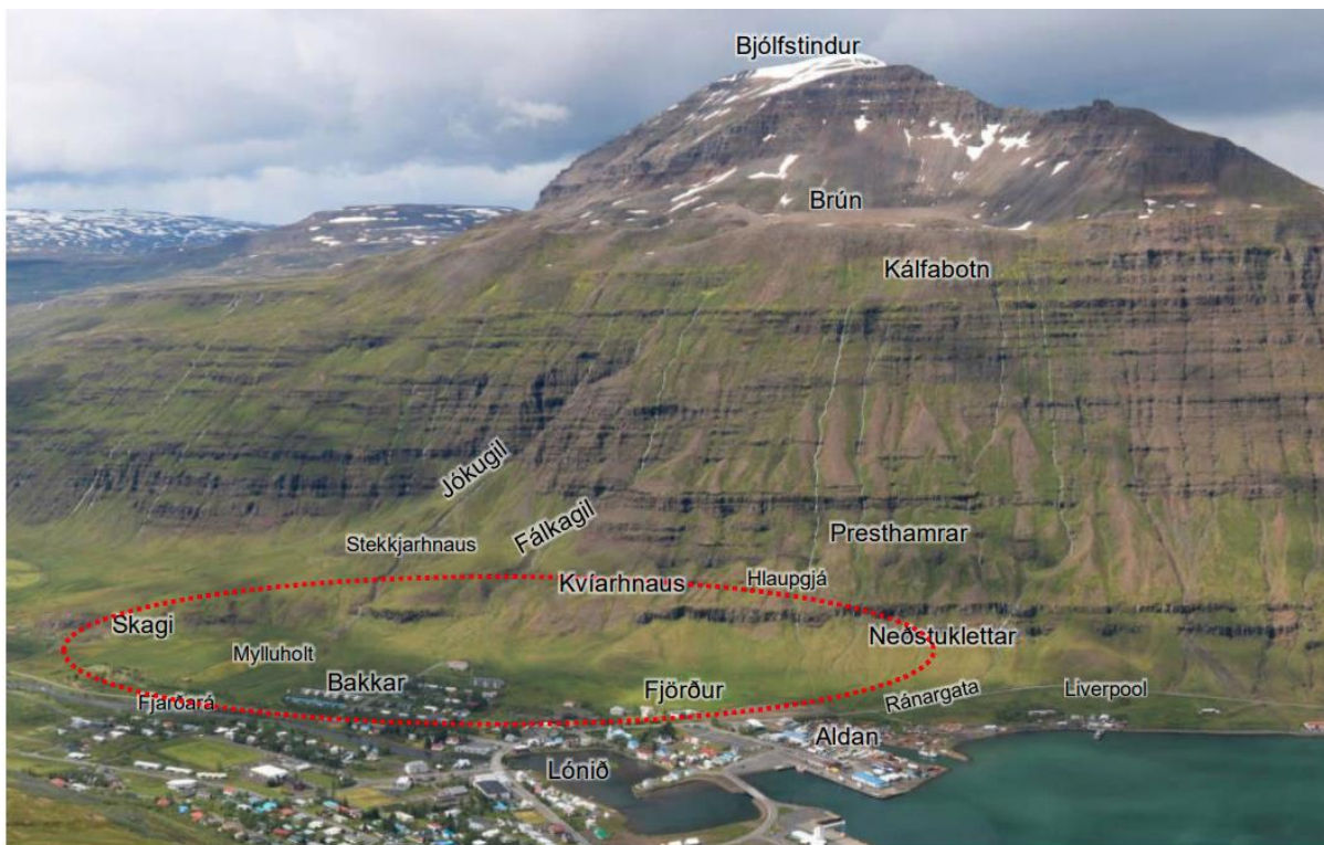
Mynd 1. Fyrirhugað skipulagssvæði, merkt með rauðum hring.