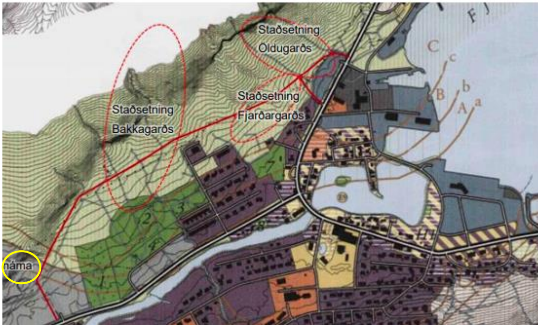
Mynd 3. Staðsetning varnargarða merktir með rauðum hring og náma merkt með gulum hring inn á þéttbýlisupprátt gildandi aðalskipulags.