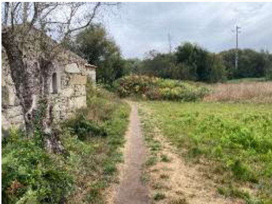
Göngustígur inn í landi