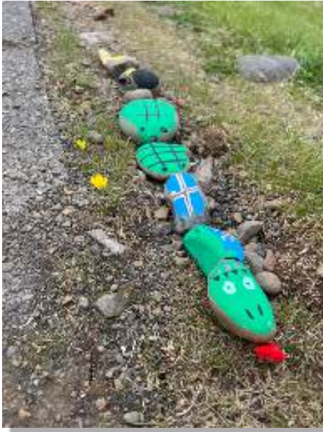
Snákurinn í júní