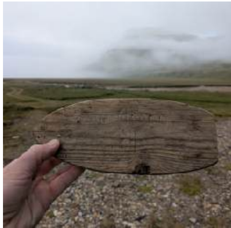
Float Your Boat