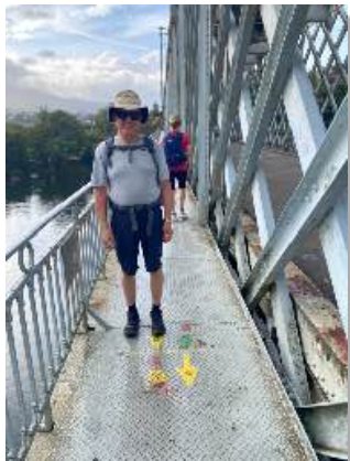
Gengið yfir landamæri Portúgal & Spánar

Eftir góða ferð með frábæru fólki um Víknaslóðir flaug ég til Kaupmannahafnar og þaðan til Porto í Portúgal. Markmiðið var að ganga frá Porto í Portúgal til Pontevedra á Spáni. Gangan hófst þann 22. ágúst og lauk 31. ágúst eftir 200 km göngu. Gengið var í gegnum tólf bæi og þorp. Camino Portugues hefur notið vinsælda á undanförunum árum vegna nálægðar við fallega Atlantshafið. Hún er nú þriðja vinsælasta Camino leiðin.