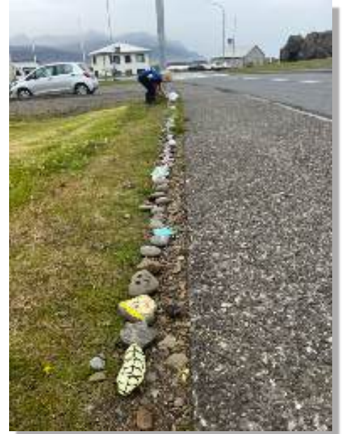
Snákurinn í ágúst

Í maí birtist lítill steinasnákur við ljósastaur í Búlandi. Við snákinn voru leiðbeiningar þar sem fólk var hvatt til að bæta við máluðum steinum og ekki fjarlægja þá sem þegar voru. Strax í júní mátti sjá snákinn margvert lengri og í ágúst var hann orðinn margra metra langur. Snákurinn gladdi og fegraði umhverfið okkar og fullkomin birtingarmynd um Cittaslow samfélagsverkefni sem tekið er eftir. Bóndavarðan veit ekki hver stóð á bakvið fyrirbærið en þakkar fyrir framtakið sem er aðdáunarvert og hvatti fólk til listsköpunar og samfélagsþátttöku.