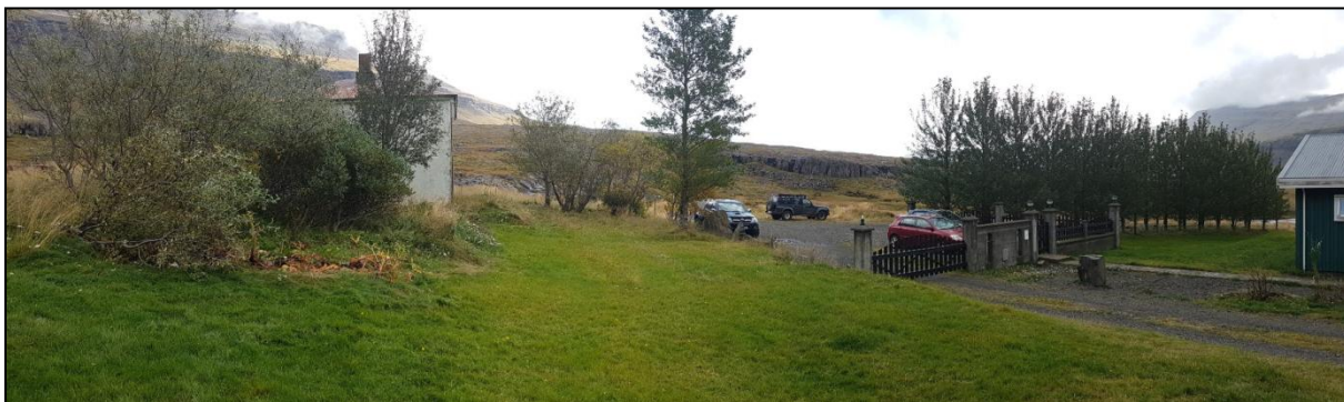
Mynd 2. Horft til vesturs yfir hlaðið í Hamarsseli. Eldra íbúðarhúsið fyrir til vinstri og núverandi íbúðarhús til hægri.