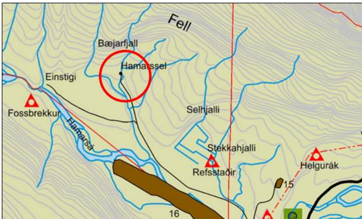
Uppdráttur 1. Aðalskipulag Djúpavogshrepps 2008 – 2020. Rauður hringur dreginn utan um Hamarsel.