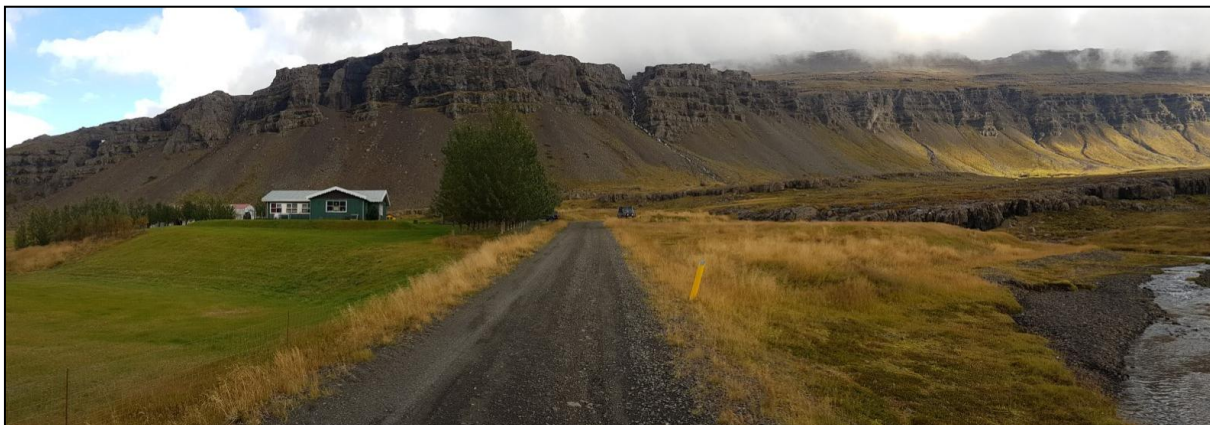
Mynd 1. Horft til norðurs heim að Hamarsseli. Íbúðarhúsið til vinstri og vinstra megin við það sést glitta í útihúsin.

Aðkoman að bænum er úr suðri og er farið upp um lítinn og velgróinn slakka áður en komið er að bæjarstæðinu. Stórar aspir standa upp með heimreiðinni og setja mikinn svip. Neðst á bæjarstæðinu, ofan við slakkann, stendur núverandi íbúðarhús um 150 m 2 að flatarmáli, byggt 1990. Norðaustan við húsið stendur eldra íbúðarhús, byggt 1948 sem er ekki í notkun. Húsið gefur svæðinu mikið gildi en þarfnast nokkurs viðhalds. Í námunda við það er trjágróður sem er kominn til ára sinna en gefur svæðinu fallett svipmót. Norðan við eldra íbúðarhúsið stóðu áður bæjar- og útihús sem lítil sem engin ummerki sjást um fyrir utan grunn af súrheysturni. Þau útihús sem nú eru í notkun, standa hins vegar nokkuð vestan við íbúðarhúsin, þ.e. fjárhús byggð 1979 og hlaða byggð 1980. Nokkru ofan við bæjartorfuna má svo finna minjar um byggingar. Steinsnar austan við íbúðarhúsin er skorningur sem um fellur bæjarlækurinn. Lítil skúr er handan lækjarins (sjá nánar yfirlitsmynd 2).