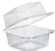
Plastbakkar með loki